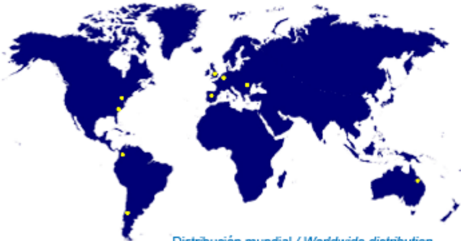
Distribución mundial / Worldwide distribution

Cada gama en diferentes alturas, diámetros, acabados y potencias. Each type in different heights, diameters, power and design construction.